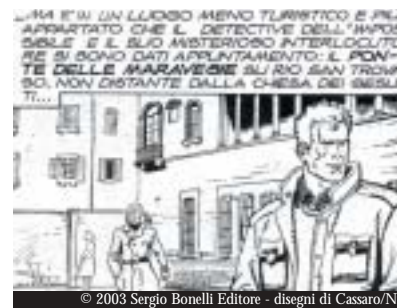
© 2003 Sergio Bonelli Editore - disegni di Cassaro/Nisi

1994, MARTIN MYSTÈRE: "THE HOUSE WITH UNSEEING WINDOWS" Martin Mystère, the detective-archaeologist, meets the golems in the Jewish Ghetto.