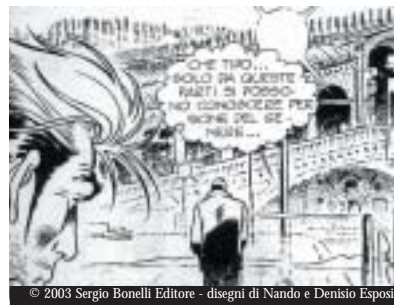
© 2003 Sergio Bonelli Editore - disegni di Nando e Denisio Esposito

1994, NATHAN NEVER: "GHOSTS IN VENICE" The melancholy Nathan Never meets Ernest Hemingway in a Venice set in the future with no water in its canals.