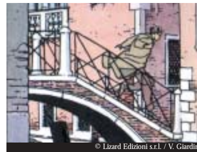
© Lizard Edizioni s.r.l. / V. Giardino

1990, "TROUBLED TRAVELS" In "Finding Paride" one of four stories by Vittorio Giardino, Venice becomes the setting for a plot to trick the art world.