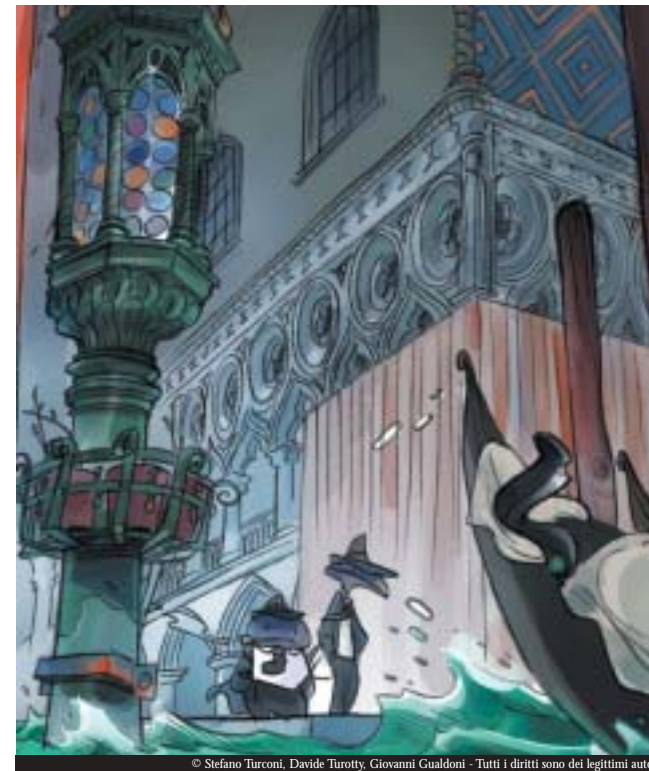
© Stefano Turconi, Davide Turotti, Giovanni Gualdoni - Tutti i diritti sono dei legittimi autori

Giraud, fu l'autore di un volume intitolato "Venezia celeste". Nel 1974 nell' "Almanacco veneziano", curato da Luigi F. Bona e pubblicato da Ciscato Editore i personaggi - Rip Kirby, Jhonny Hazard, Achille Talon, si muovevano per le calli della città. "Il Giornalino", celeberrimo settimanale per ragazzi pubblicò "Salvate Venezia" di Castelli e Zeccara. Ma anche Danny Futuro, il personaggio di Jimenez e Mora che doveva combattere le mostruose alghe che avevano invaso la laguna. Ed infine il mago Mandrake che fu catapultato a Venezia da Falk e Davis, gli autori, in "La caccia al tesoro".