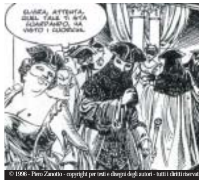
© 1996 - Piero Zanotto - copyright per testi e disegni degli autori - tutti i diritti riservati

1996, "THE STORY OF THE NIZIOLETI" Piero Zanotto with drawings by Paolo Piffarario, tells the stories behind Venetian place names through the medium of the comic.